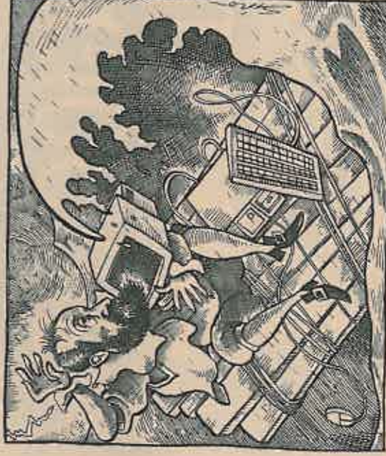
Povero Ortelio, celebre cartografo del XVI secolo. La banca dati che ha preso il suo nome ha ovvto una navigazione davvero turbolenta, rischiando il naufragio

un errore, sia noi che l'Unione Europea - riconosce un funzionario che ha preso parte al progetto e che preferisce non essere citato - . Loro hanno sbagliato a pensare che potessimo andare avanti da soli, noi ad assicurare che ce l'avremmo fatta».